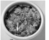
いりこ飯 だしがよく出てさっぱりとした炊き込みごはん