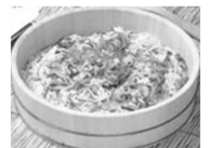
ばらすし ちらしすし、かきまぜすしなどの呼び名がある